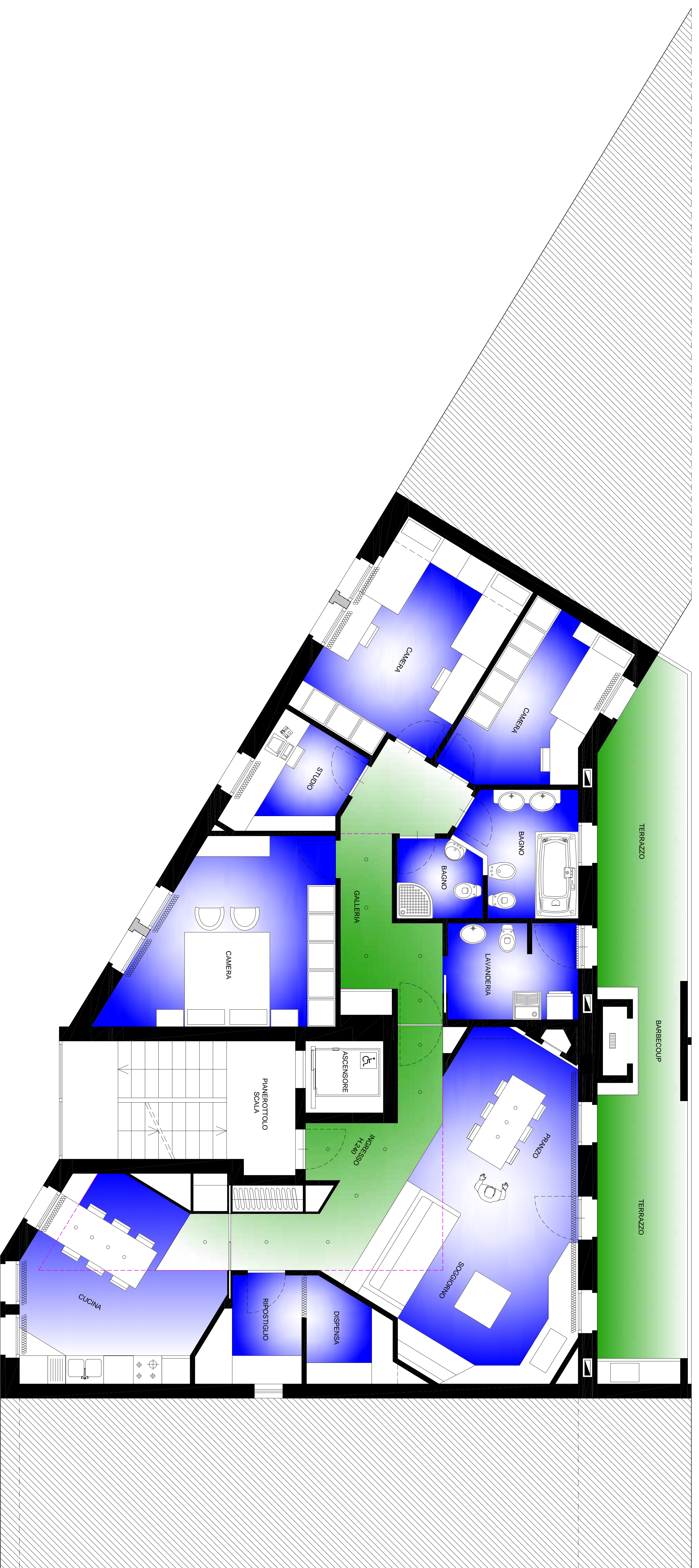
PIANTA PIANO SECONDO